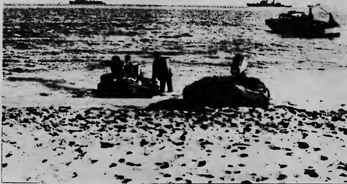
PALOMARES, ESPANJA--Soldados de Merca ta subiendo costa banda de Palomares, na costa sudeste di Espanja, na unda nan a perde un arma atomico. Awe lo yega un submarino chikitu pa yuda den e busqueda di e arma atomico.